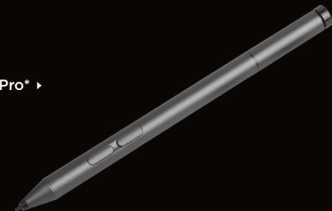
Lenovo Pen Pro* ▶