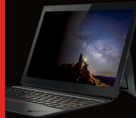
Lenovo Blickschutzfilter von 3M für X1 Tablet G3