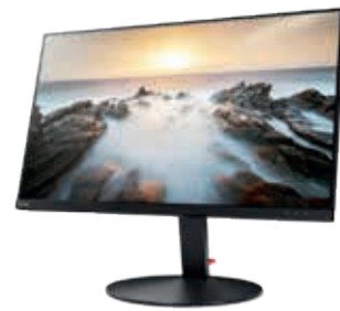
Lenovo ThinkVision® P32u