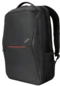
Lenovo ThinkPad Professional 39,6-cm-Rucksack (15,6")