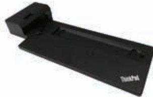
Lenovo ThinkPad® Pro Andockstation